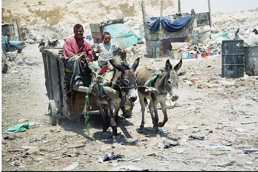
Aan het werk Op een vuilnisbelt in Cairo, Egypte