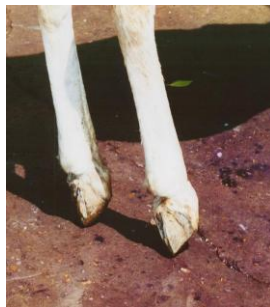
Vergroeide hoeven door verkeerde hoefijzers